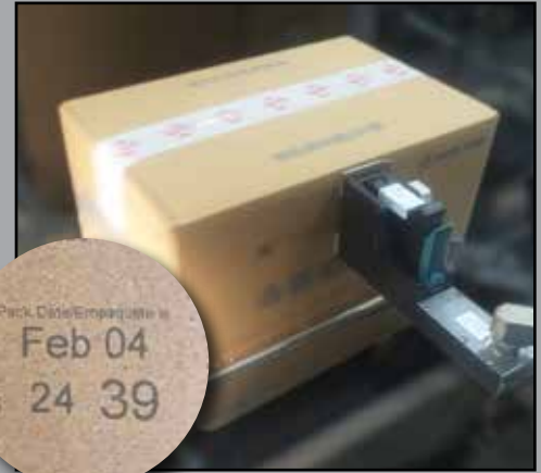
Förderbandmontage – Druck auf Pappkarton