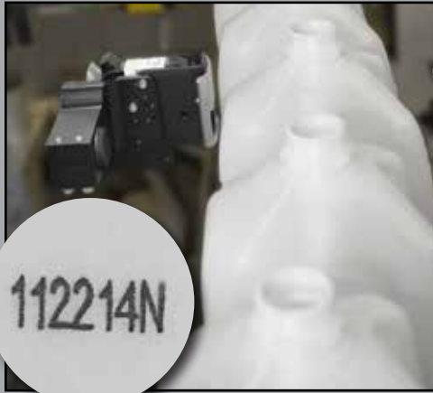
Transportbandmontage – Bedrucken von Plastikflaschen