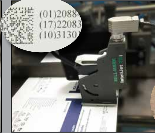
Montage an einer horizontalen Beuterverschließmaschine