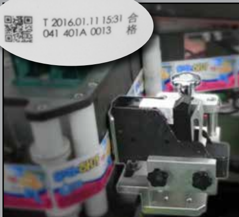
Montiert an einer Etikettiermaschine